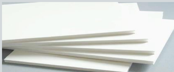
Isolamento termico "sistema a cappotto"