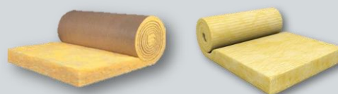
VELAGLASS ROLL 39 K VELAGLASS ROLL 39 N